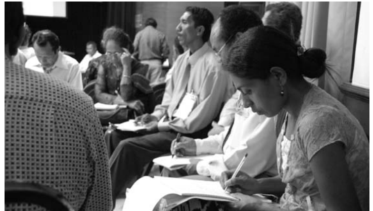
Partisipantes iha Sorumutu Nasional husi Distritu Bobonaro diskuti kona-ba sira nia esperensia iha PDL.

S.E. Ministro Dr. Arcângelo Leite iha sorumutu ne'e hateten, "Governo iha kontiudo atu aselera politika kona-ba decentralizasaun. Ita buka atu korije buat ne'ebé lalos, no halo evaluasun kona-ba serbisu ne'ebé ita halo ona to'o agora." Tan ne'e, sorumutu ne'e importante atu