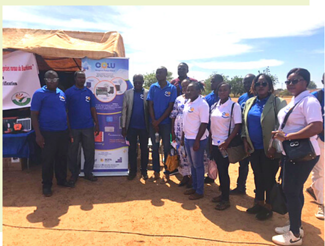
Photo de famille avec l'équipe OOLU et celle de UNCDF Burkina Faso

Grâce à la mise en relation avec les autres partenaires du projet, une collaboration avec la structure de micro-finance Micro Start a été initiée et sera renforcée par la suite pour avoir plus d'impact.